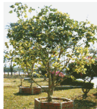
ต้นปาริชาติ