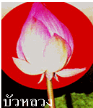
บัวหลวง ดอกบัวหลวง